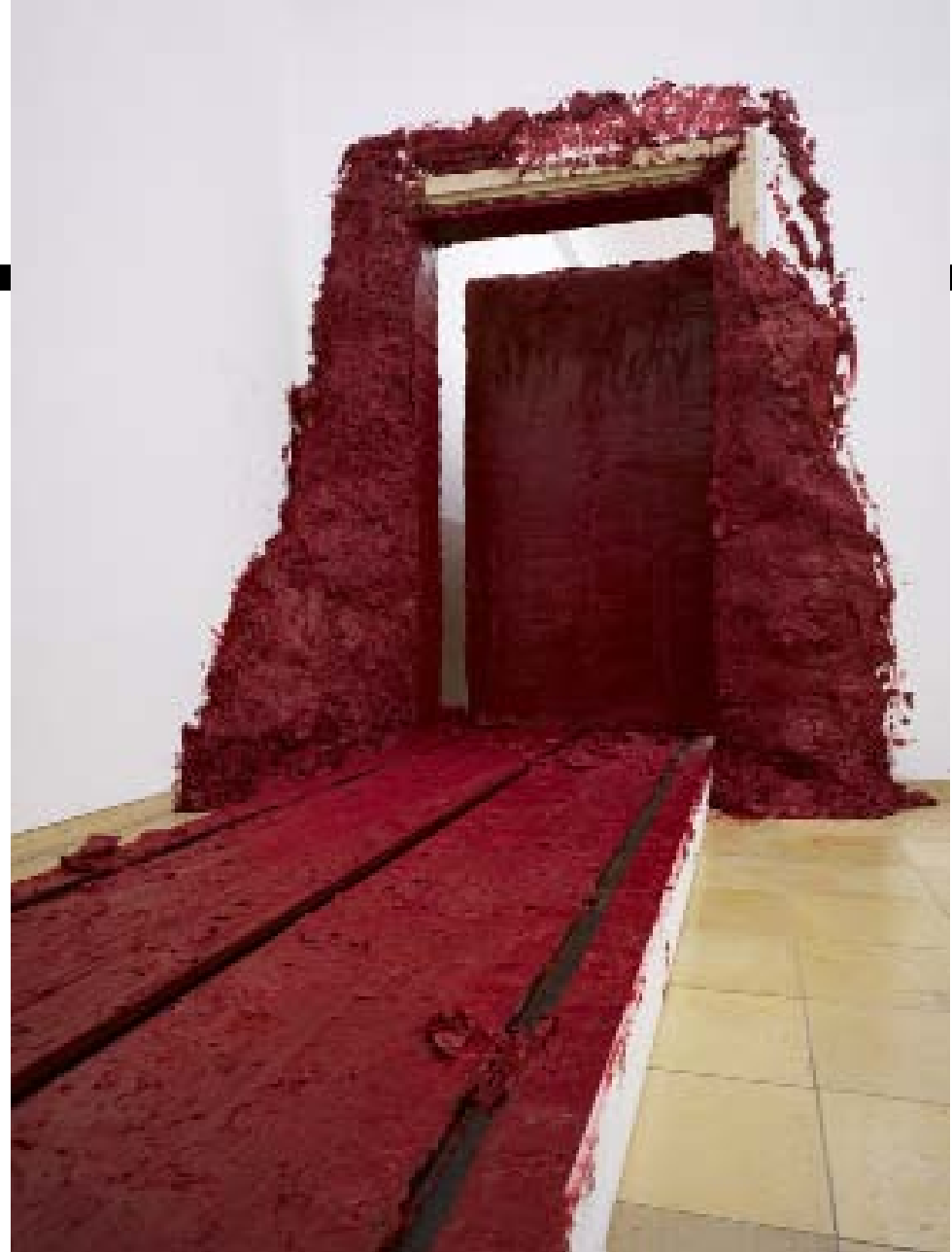
Anish Kapoor, Svayambh, Haus Der Kunst, Munich, 2007