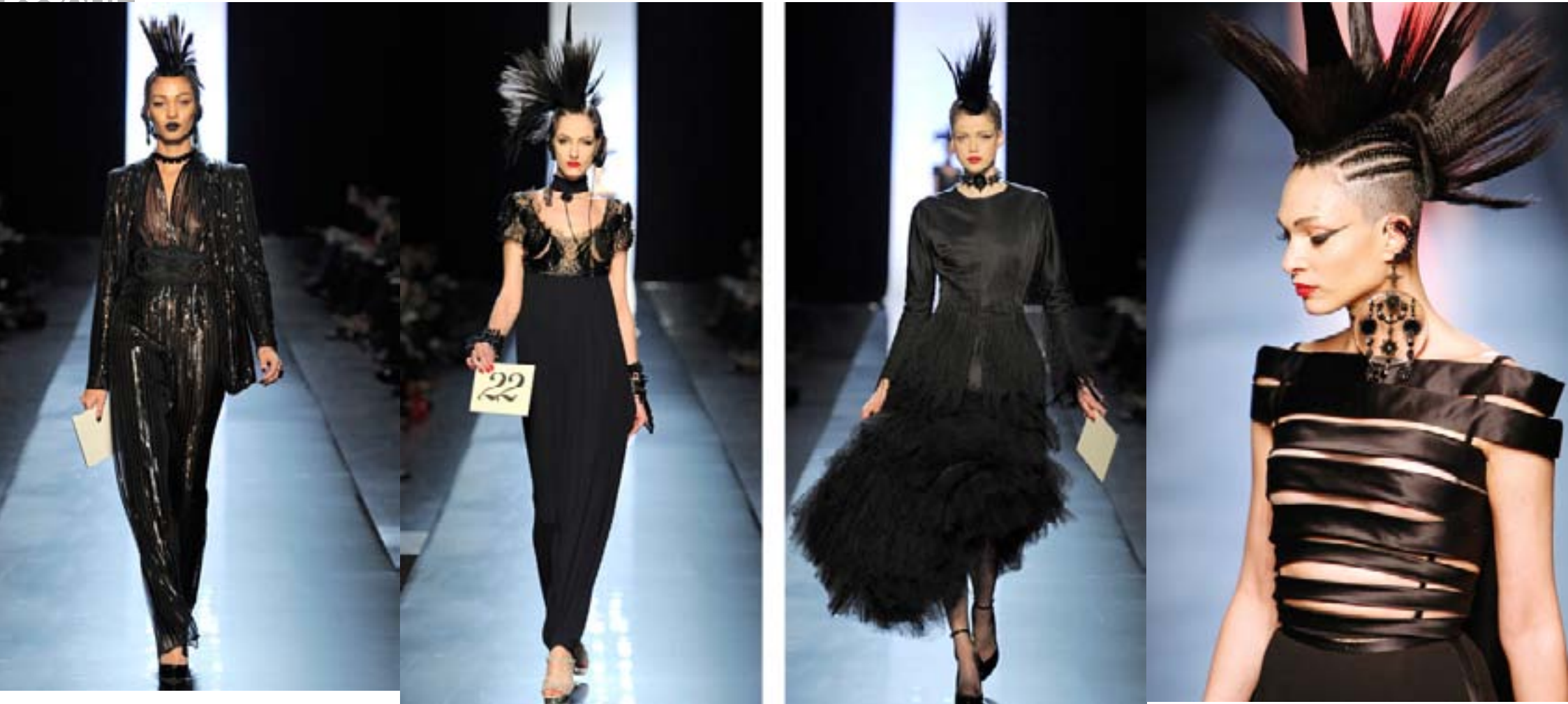
Jean-Paul Gaultier, Défilé pour la collection haute couture, 2011