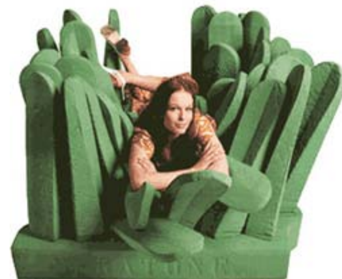
Siège Pratone, Gruppo Strum (Ceretti, Derossi, Rosso), 1971