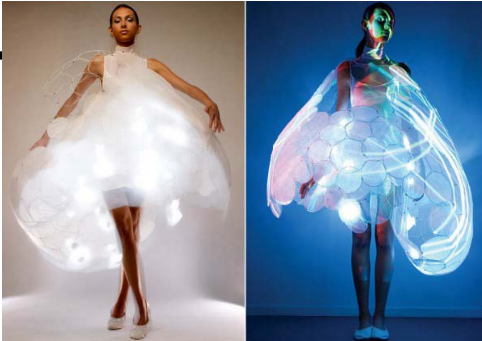
Robes Bubelle et Frisson Body Suit, Skin Probe Project, Philips Design 2007