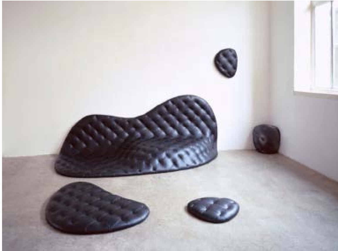
«Pools and Poufs», Robert Stadler, 2004