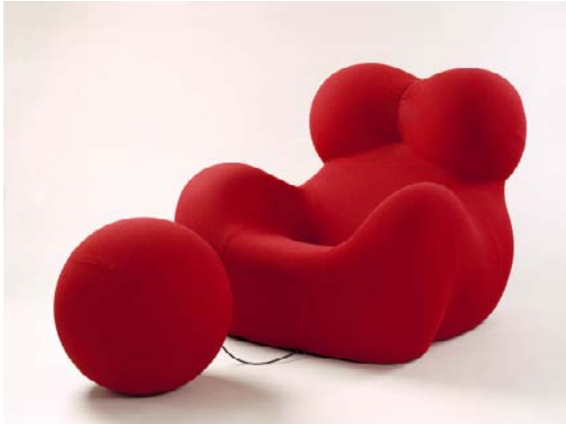
«La mama», Fauteuil UP, Gaetano Pesce, 1969