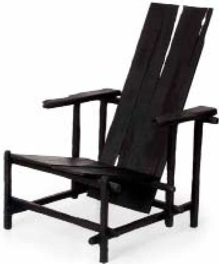
Siège Smoke (Red and Blue Chair, Gerrit T. Rietveld) édition Baas & den Herder, 2004, bois carbonisé