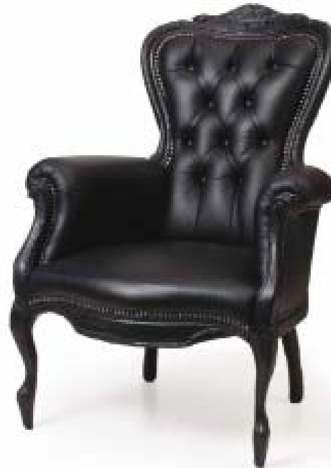
Fauteuil Smoke, édition Mooof, 2002, bois et cuir carbonisés