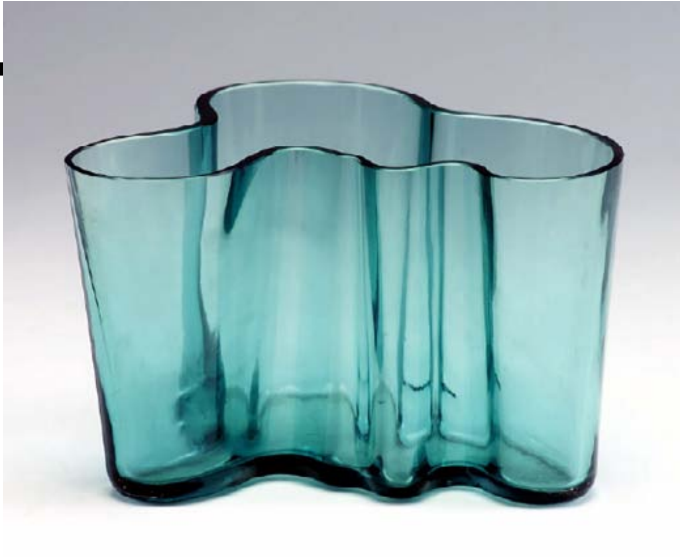
Vase Savoy, Alvar AALTO, 1936