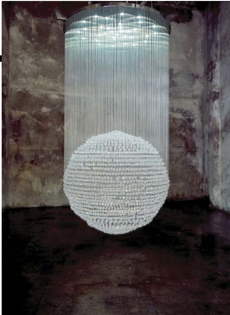
Chandelier «Crystal Palace», Tom Dixon, 2003