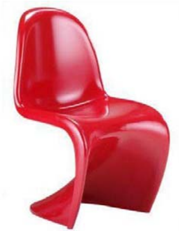
Verner Panton, Chaise Panton, 1960