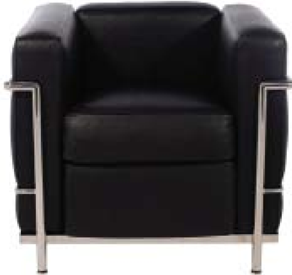
Fauteuil Grand Confort, Le Corbusier et Charlotte Perriand, 1927-28